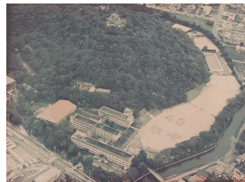
小牧山に建てられていた小牧中学校 昭和62年撮影

一般的に「学校」とは学校教育法第1条に定める学校のことを指し、具体的には、幼稚園、小学校、中学校、義務教育学校、高等学校、中等教育学校、特別支援学校、大学及び高等専門学校のことをいいます。今号では、小牧市内の小・中学校について調べる方法をお伝えします。