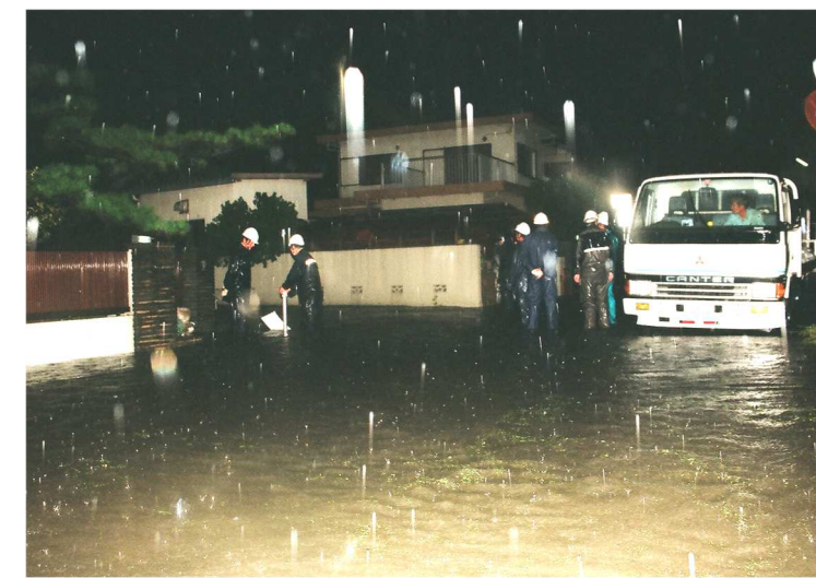
東海豪雨時の市内の様子

小牧ではいつ、どこに、どのような水害が起こっていたのでしょうか。小牧が大きな被害を受けた水害といえば、「入鹿切れ」「伊勢湾台風」「東海豪雨」があげられますが、その他にも様々な水害の記録があります。様々な資料からは、今も昔も人々は変わらずに水の脅威に悩まされ、経験から学び、対策をして、備えてきたことがわかります。突然起こる水害の脅威に備えて、過去の記録を調べてみましょう。