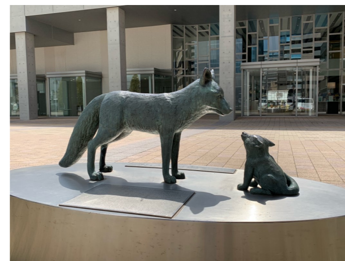
小牧市中央図書館横にぎわい広場 吉五郎親子の像 (令和6年3月撮影)